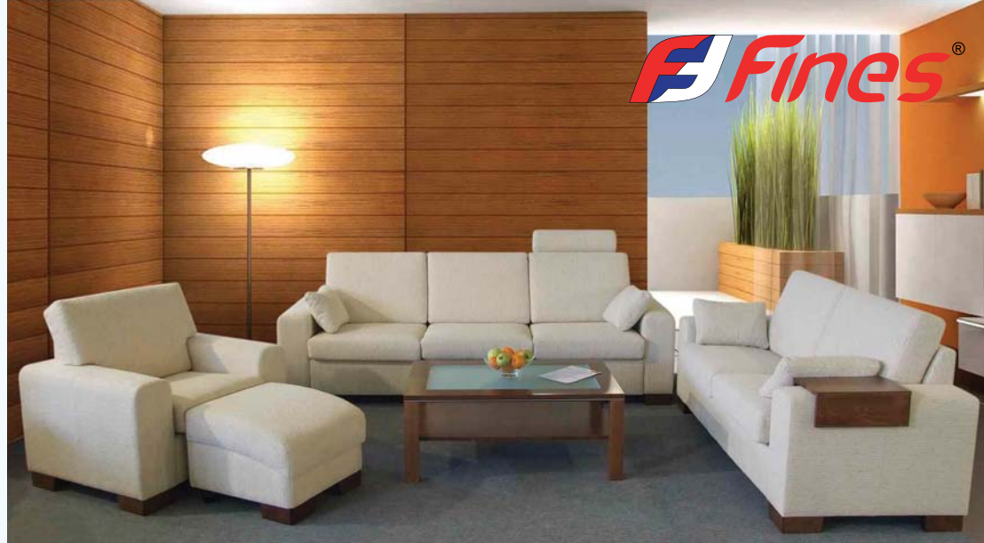
noha H1 hranol 6x6cm